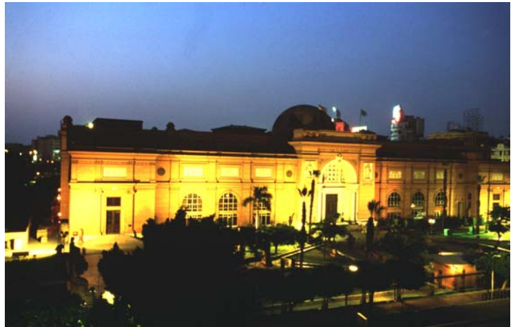
Das Ägyptische Museum in Kairo (Tahrir-Platz)

Der Khedive Abbas Helmi II. legte bereits 1897 den Grundstein für das Museum am Tahrir-Platz, dessen Sammlung inzwischen über 100.000 Objekte aus ganz Ägypten umfasst.