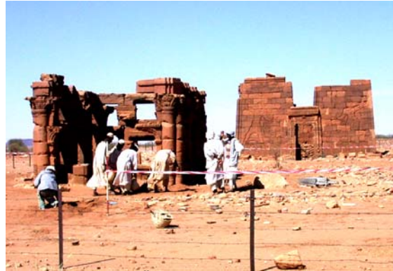
Ausgrabungsfoto des Ägyptischen Museums-Berlin im Sudan

Die Entdeckung dieser antiken Identität könnte auch einen Beitrag zur Identitätsfindung des heutigen Sudan leisten; einer Region, die selbstbewusst ihre Zukunft gestalten will.