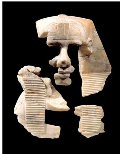
Eine neue Rekonstruktion

Im Vortrag werden sowohl die Geschichte der herausragenden Sammlungen, aktuelle Ereignisse, aber auch Planungen für die Zukunft präsentiert.