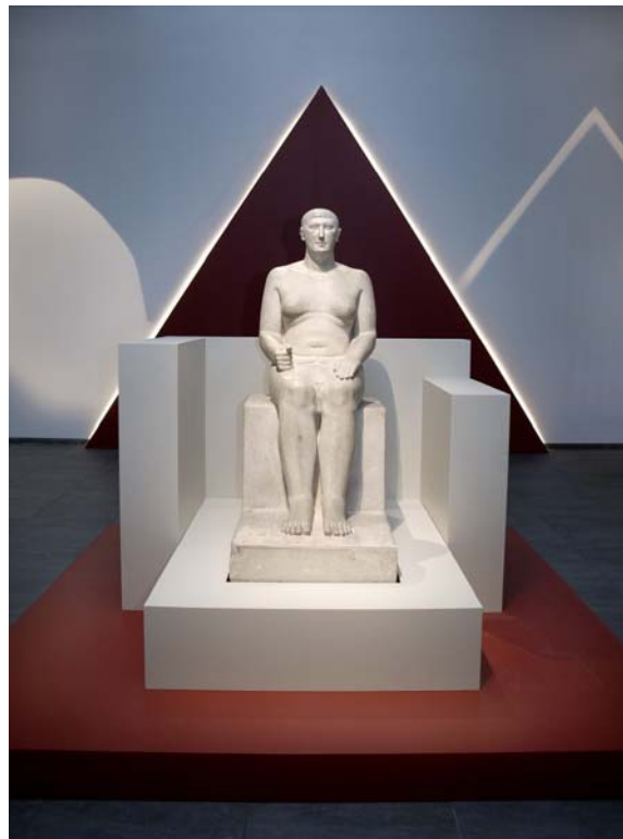
Hemiunu "Vorsteher aller Bauarbeiten des Königs"

Wir bitten um Anmeldung bis zum 20.8.2010 bei Gisela Gallehr auf dem Anmeldevordruck